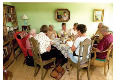
Så er der dækket op til eftermiddagskaffe.

Hele arrangementet inkl. kaffebord: Voksne kr. 100 og børn kr. 50