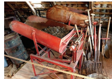
Udstyr fra handel med fast brændsel.

Rundvisningen starter i magasinet, hvor der er udstyr fra 130 års handelsvirksomhed og tekstiler fra 200 år . Se folderens to sider herom.