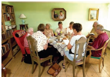
Så er der dækket op til eftermiddagskaffe.

Søndage ankomst kl. 14.30 – til senest kl. 17.30 i juli og august Hele arrangementet inkl. kaffebord: Voksne kr. 100 og børn kr. 50