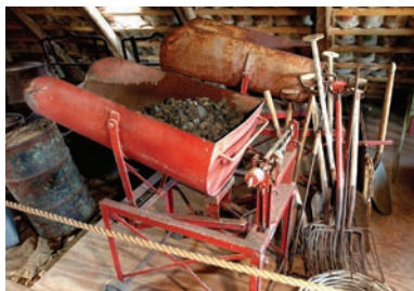
Udstyr fra handel med fast brændsel.

Rundvisningen slutter i den gamle prydhave med en kampestensbrønd , der forsynede de søfarende med vand – og et lysthus fra o. 1860, hvor der bydes på et glas hvidvin.