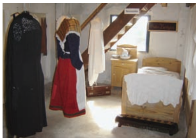
Tekstiludstillingens afsnit med sengeudstyr og beklædning.