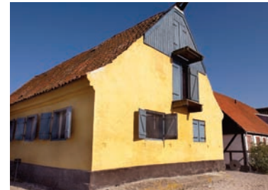
Tekstiler i underetagen og handelsudstyr på loftet.

I samarbejde med Økomuseum Samsø Juli og august: Onsdage start kl. 16 til ca. 17.30 Deltagelse inkl. et glas ved Lysthuset: Voksne kr. 50 og børn kr. 25.