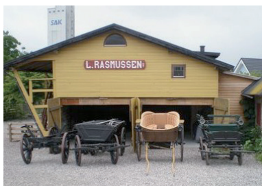
Arbejdsvogne fra o. 1900, jumpe o. 1920 og fjedervogn o. 1880.