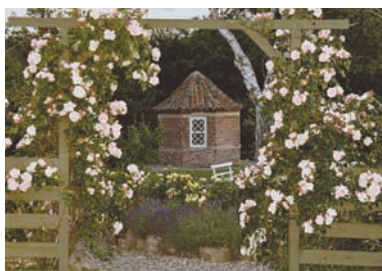
På vej ned til Det gamle Lysthus – og den afsluttende forfriskning.

Invitation til at opleve Den gamle Købmandsgård – både inde og ude – som var du/I på besøg hos købmandsfamilien for 100 år siden!