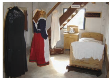
Tekstiludstillingens afsnit med sengeudstyr og beklædning.

Antal tilmeldte samme dag kl. 12 i Den gamle Butik, på 8659 0001 eller på info@kobmandsgarden.dk . bestemmer om arrangementet holdes. Som alternativ kan tilbydes rundvisning samme dag kl. 14.30 – 16.