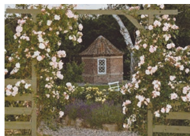
På vej ned til Det gamle Lysthus – og den afsluttende forfriskning.