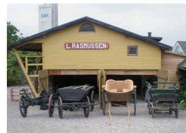
Arbejdsvogne fra o. 1900, jumpe o. 1920 og fjedervogn o. 1880.

Der bliver også lejlighed til at studere stedets gamle dokumenter, herunder bogføringen siden grundlæggelsen i 1844 og frem til 1960-erne. Måske kan du/I finde oplysninger om, hvad dine/jeres forfædre har købt hos Firmaet L. Rasmussen ?