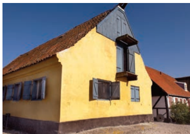
Tekstiler i underetagen og handelsudstyr på loftet.

Deltagelse inkl. et glas ved Lysthuset: Voksne kr. 50 og børn kr. 25.