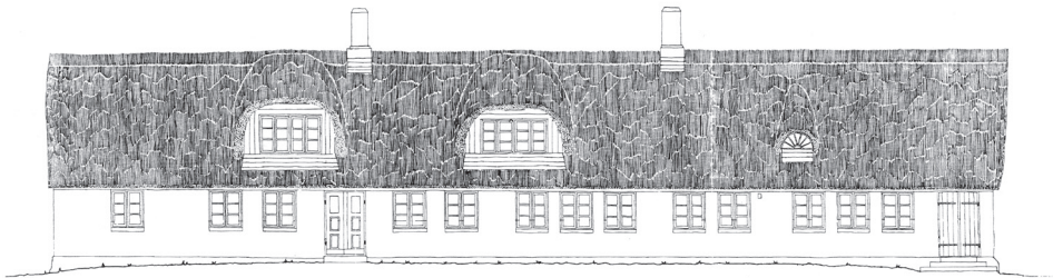
Sydfacaden af Den gamle Købmandsgård