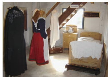
Tekstiludstillingens afsnit med sengeudstyr og beklædning.

Som alternativ til et separat Udvidet Besøg opfordres til at deltage i en af de skemalagte Rundvisninger på onsdage og søndage i juli og august.