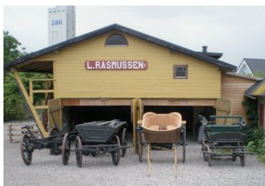
Arbejdsvogne fra o. 1900, jumpe o. 1920 og fjedervogn o. 1880.