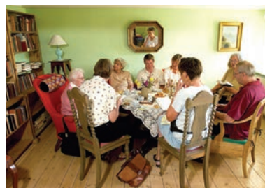
Så er der dækket op til eftermiddagskaffe.

Arrangeres separat for grupper på mindst otte – typisk fra 14.30 til 17.30. Aftales via telefon 8659 0001 eller info@kobmandsgarden.dk Deltagelse inkl. kaffebord og vin / juice: Voksne kr. 160 og børn kr. 80.