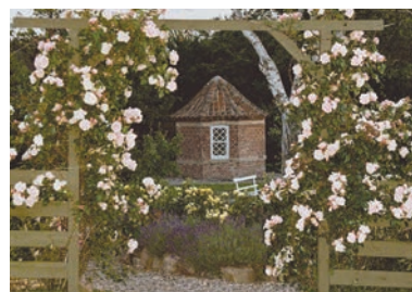
På vej ned til Det Gamle Lysthus – og den afrundende forfriskning.