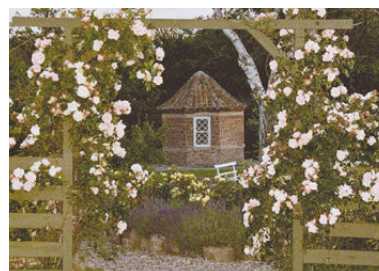
På vej ned til Det gamle Lysthus – og den afsluttende forfriskning.