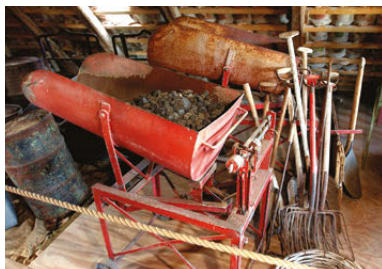
Udstyr fra handel med fast brændsel.

Rundvisningen slutter i den gamle prydhave med en kampestensbrønd , der forsynede de søfarende med vand – og et lysthus fra o. 1860, hvor der bydes på et glas hvidvin.