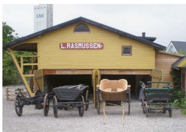
Arbejdsvogne fra o. 1900, jumpe o. 1920 og fjedervogn o. 1880.