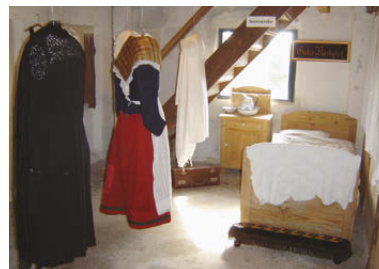
Tekstiludstillingens afsnit med sengeudstyr og beklædning.

Antal tilmeldte samme dag kl. 12 i Den gamle Butik, på 8659 0001 eller på info@kobmandsgarden.dk . bestemmer om arrangementet holdes. Som alternativ kan tilbydes rundvisning samme dag kl. 14.30 – 16.