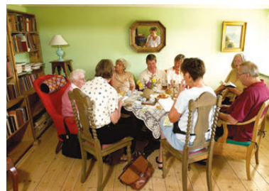
Så er der dækket op til eftermiddagskaffe.

Hele arrangementet inkl. kaffebord: Voksne kr. 100 og børn kr. 50