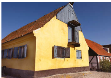
Tekstiler i underetagen og handelsudstyr på loftet.

Deltagelse inkl. et glas ved Lysthuset: Voksne kr. 50 og børn kr. 25.